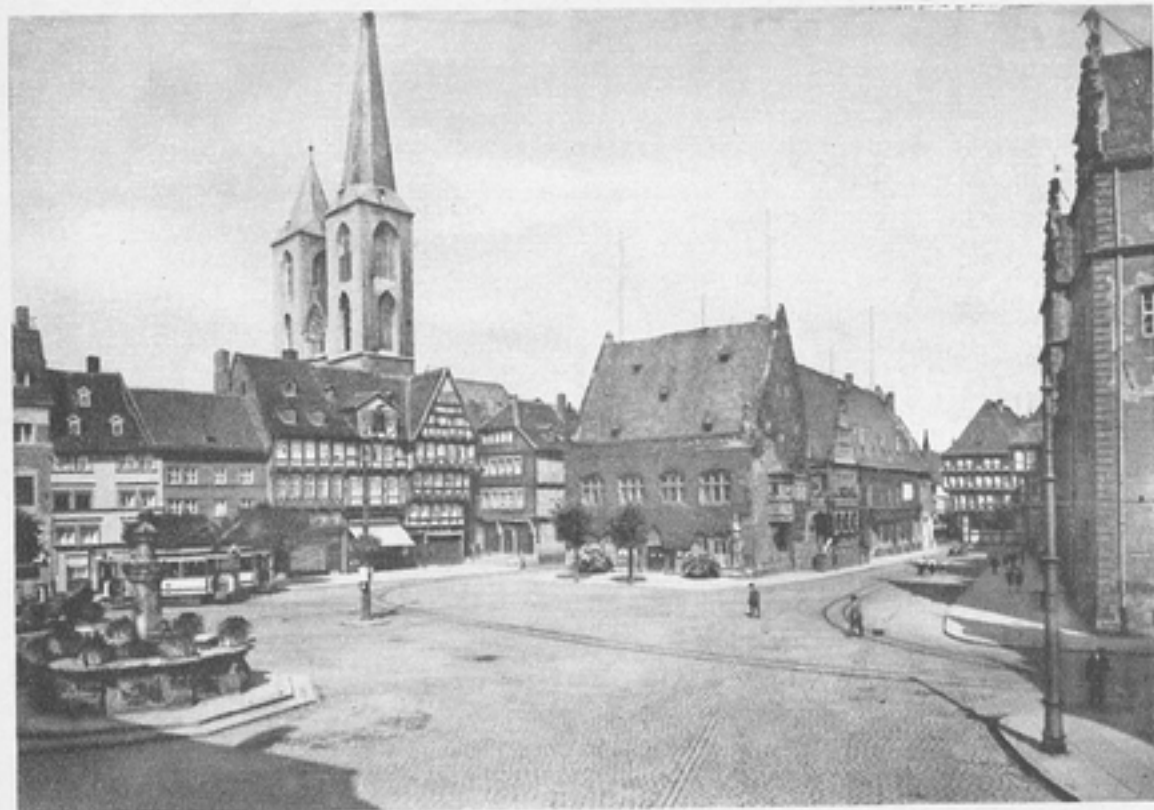
Holzmarkt mit Martinikirche und Rathaus in Halberstadt Die Berliner Gruppe bringt in der Reihe „Querschnitte durch Städte“ am 16. Juli einen Hörbericht aus Halberstadt

springen, um die Wahrheit zu erfahren. — Immer hatte ich in diesen Monaten chaotischer Begebenheiten gewartet, daß an irgendeiner Stelle Berlin zu reden beginnen würde. Mitten in der Nacht fing es tatsächlich zu sprechen an. An einer Bruchstelle platzte der straffe Betrieb: Explosion! Durch die Bruchstelle steckte ein Mensch sein Gesicht, ganz aufgelöst von Tempo, Geschäft, Verkehr, Profit und Reinfall. Ich war ein Instrument, um den Kriminalfall mit der allgemeinen Wirklichkeit zu verbinden.